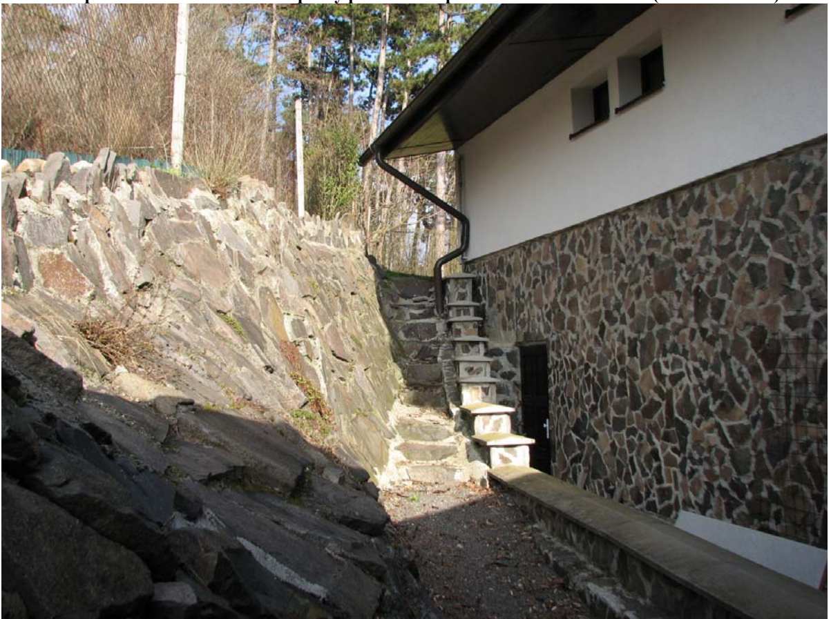
5.3.2014 detail spevneného svahu, bočná stena domu