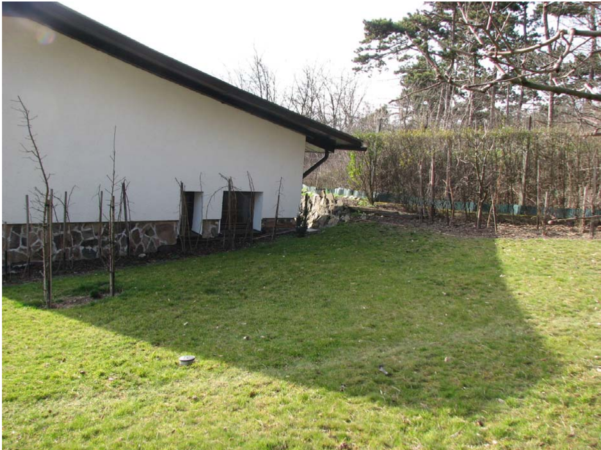
5.3.2014 pohľad zo záhrady na zadnú stenu domu