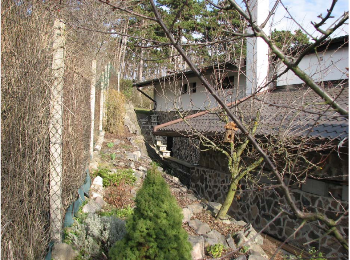
5.3.2014 – pohľad od ulice - terénne úpravy pozemku a spevnenie svahu kameňom (severná strana)